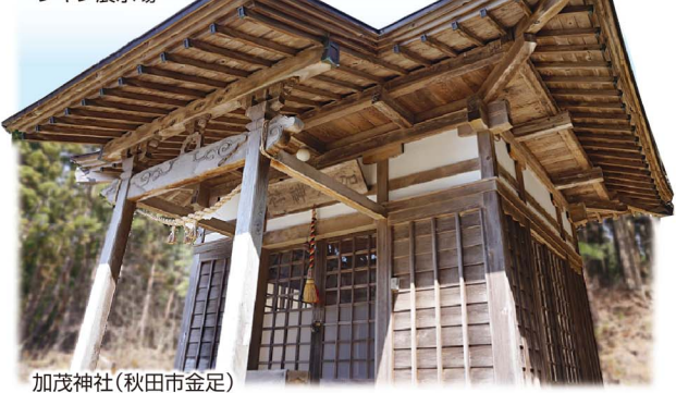
加茂神社(秋田市金足)