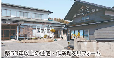
築50年以上の住宅・作業場をリフォーム